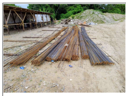
12. Estoque de aço