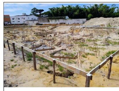
03. Início da montagem de formas e armadura dos blocos de fundação