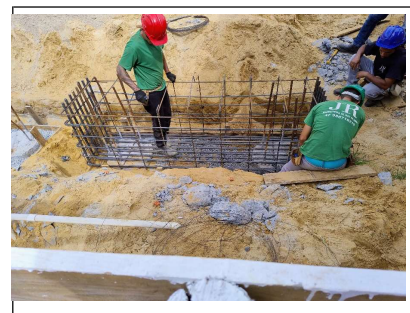
06. Montagem da armação dos blocos da torre A