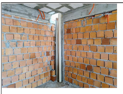
13. Rede pluvial e esgoto