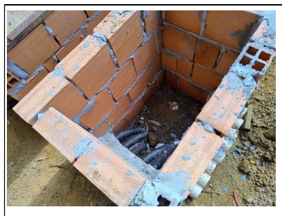
05. Caixa de entrada de energia