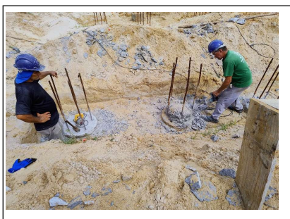
07. Preparo da cabeça das estacas

Este relatório possui a finalidade de apresentar os registros fotográficos dos fatos mais relevantes do período.