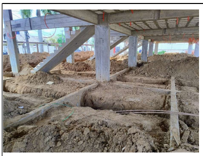
04. Escavações para passagem de redes eletrica e hidraulica