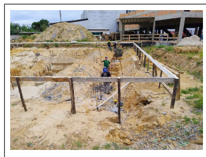
09. Montagem de aço nos blocos de fundação e preparo das estacas