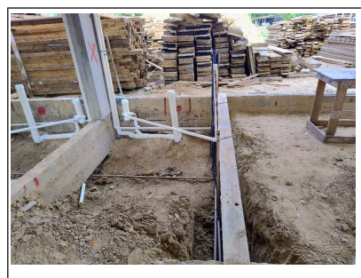
15. Infra de esgoto