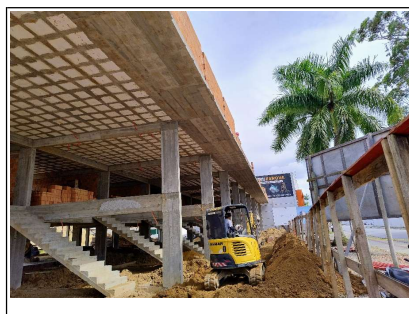
02. Escavações para passagem de redes eletricas