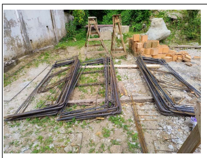
08. Aço dos blocos de fundação