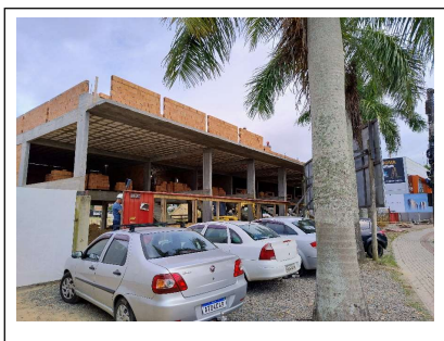
01. Fachada lojas frontais - Boulevard Jardins

1 Realizado global da obra (Incluso medição antes do diagnóstico da OGFI).