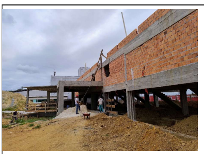
10. Fundos das salas comerciais