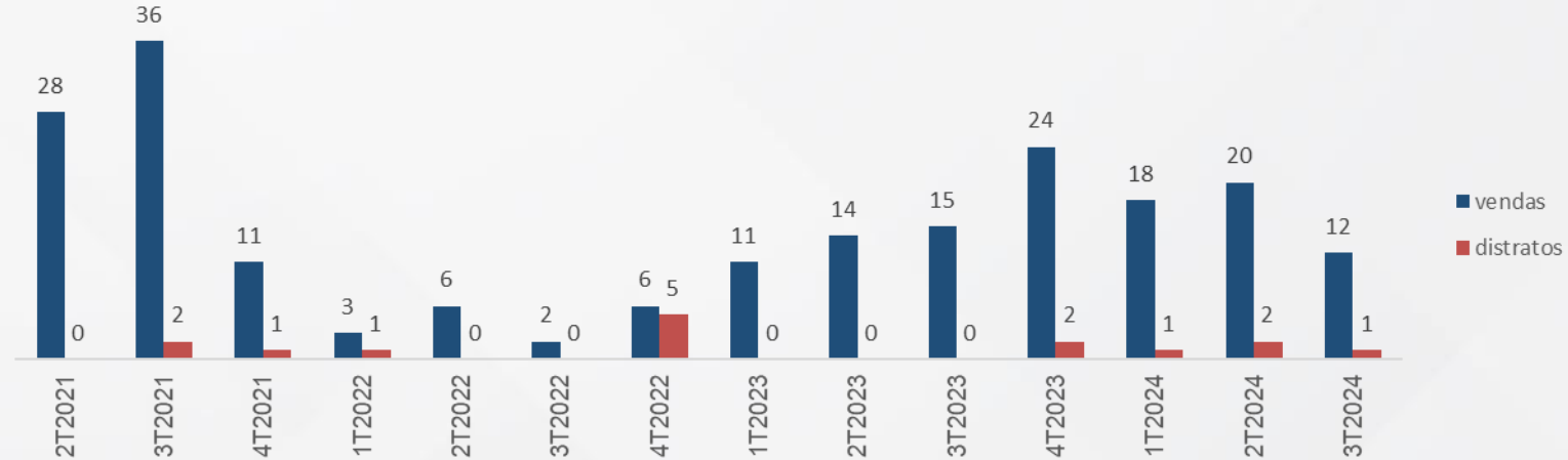
Histograma de Vendas

O empreendimento possui 56 unidades e 1 loja em estoque. O total (unidades e lojas) somam um VGV R$ 23.039.500,00 (conforme Tabela de vendas) ou R$ 18.451.899,85 (Considerando o VUV médio dos 6 últimos meses que ocorreram vendas, por tipologia).