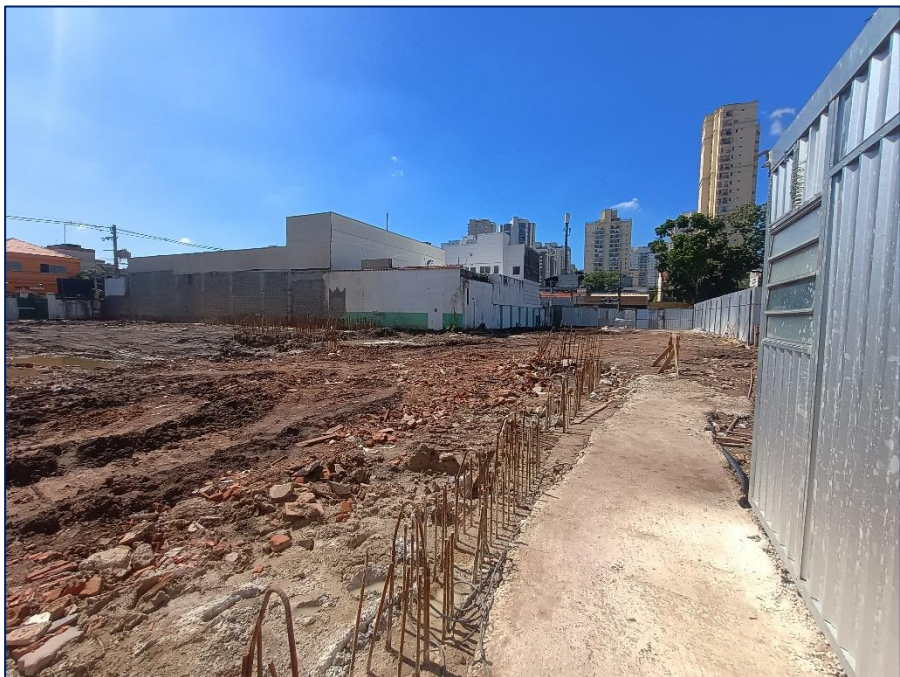
Foto 5 - Visão geral terreno