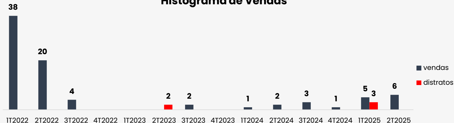
Histograma de Vendas

O empreendimento possui 61 unidades em estoque, somando um VGV de R$ 39.279.749,91 (Tabela de vendas) ou R$ 29.773.563,01 (Considerando o VUV médio das vendas realizadas nos últimos 6 meses, consecutivos ou não, considerando o gradiente de cada unidade).